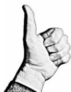
rys. 1 powodzenia (wskazówki)