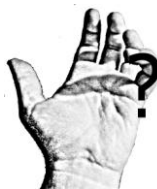
rys. 2 czego nie wiem?

Dobrze jest prowadzić jakieś zapiski i odpowiedzi zostawiać w formie pisanej. Systematyczne otwieranie się na Boże Słowa zapewni nam umocnienie wiary i chrześcijański wzrost.